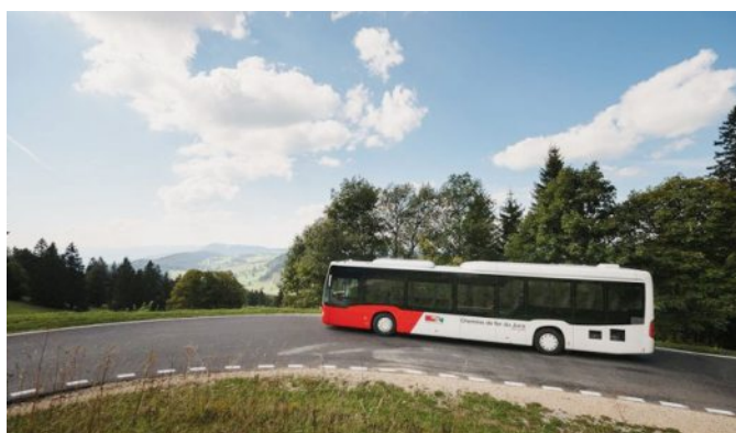
CarPostal reprendra la gestion des lignes de bus jurassiennes dès décembre 2021.