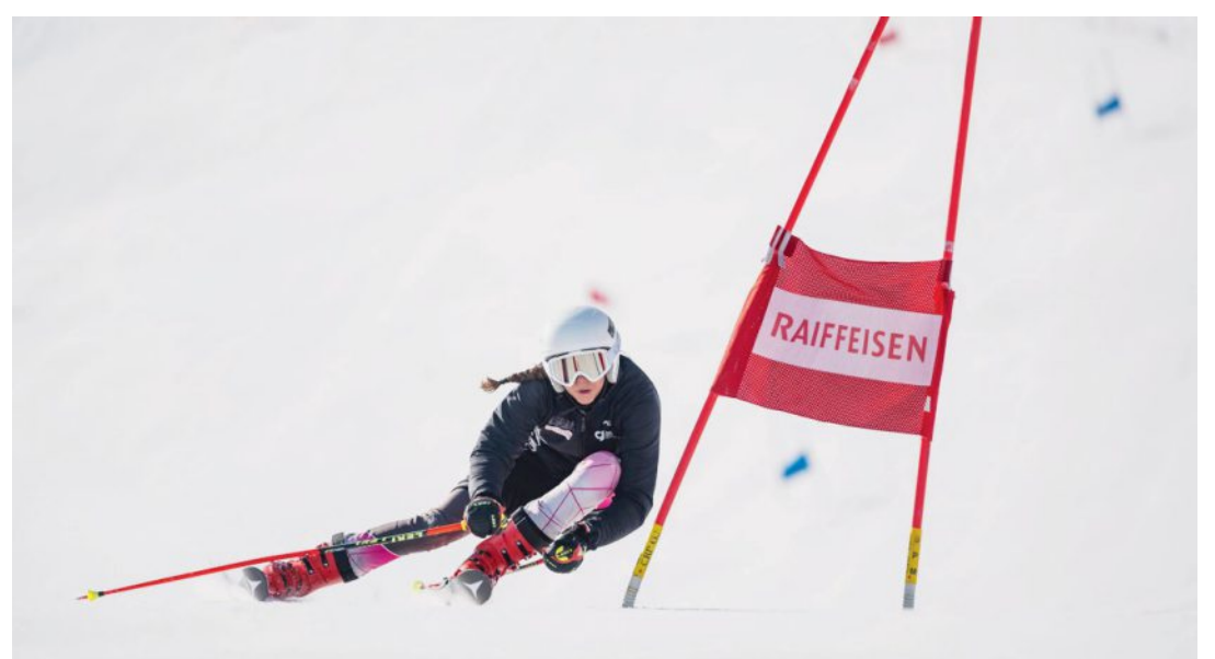
Le Giron jurassien des clubs de sports d'hiver propose différents défis, dont quatre exclusifs pour ses événements régionaux.

Une fois par mois, de janvier à mars, un entraînement comparatif pour les jeunes skieurs M16 des ski-clubs se tiendra sous la forme du Ragusa Ski Cup Challenge 21. L'objectif est d'entretenir l'envie de performance, en complément des plans d'entraînement existants. Il suffit que le skieur soit licencié et son ski-club peut l'inscrire.