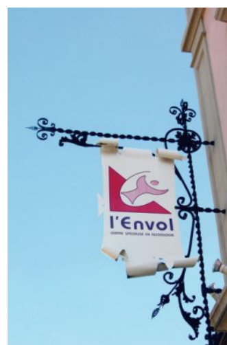
A Tramelan, l'Envol fait aussi partie de l'AROUP.