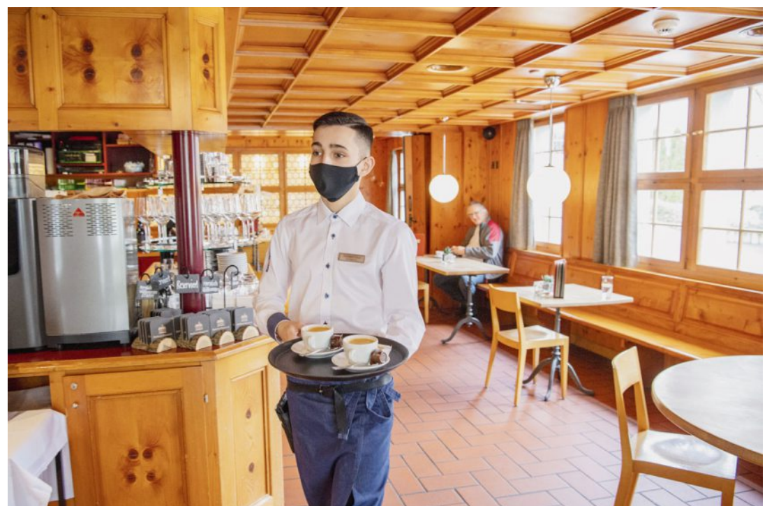
Le secteur de l'hôtellerie-restauration a été particulièrement impacté par la crise du Covid.

Ces modifications, surtout celles ayant un effet rétroactif, n'ont pas conduit à une baisse de la charge de travail, mais au contraire à une augmentation. Des demandes ont ainsi dû être traitées plusieurs fois, et ces changements constants ont créé des incertitudes chez les entreprises concernées.