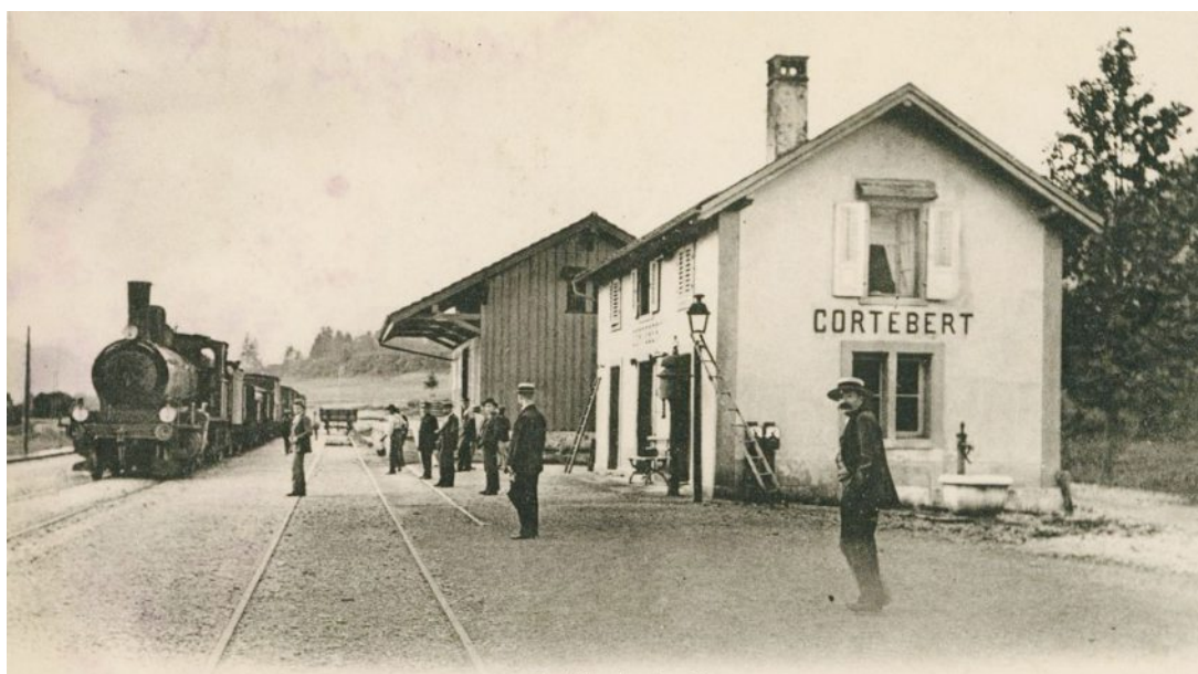
Deux images fortes du Cortébert d'antan. Le bâtiment de l'hôtel de la Croix est toujours existant.