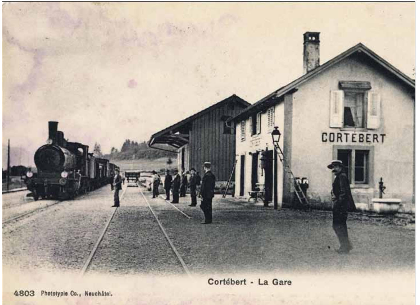
La gare de Cortébert, bien avant l'électrification de la ligne en 1934. On remarquera le réverbère et son échelle, la balance et la cloche... A l'arrière-plan, le hangar des marchandises acheminées en «petite vitesse».