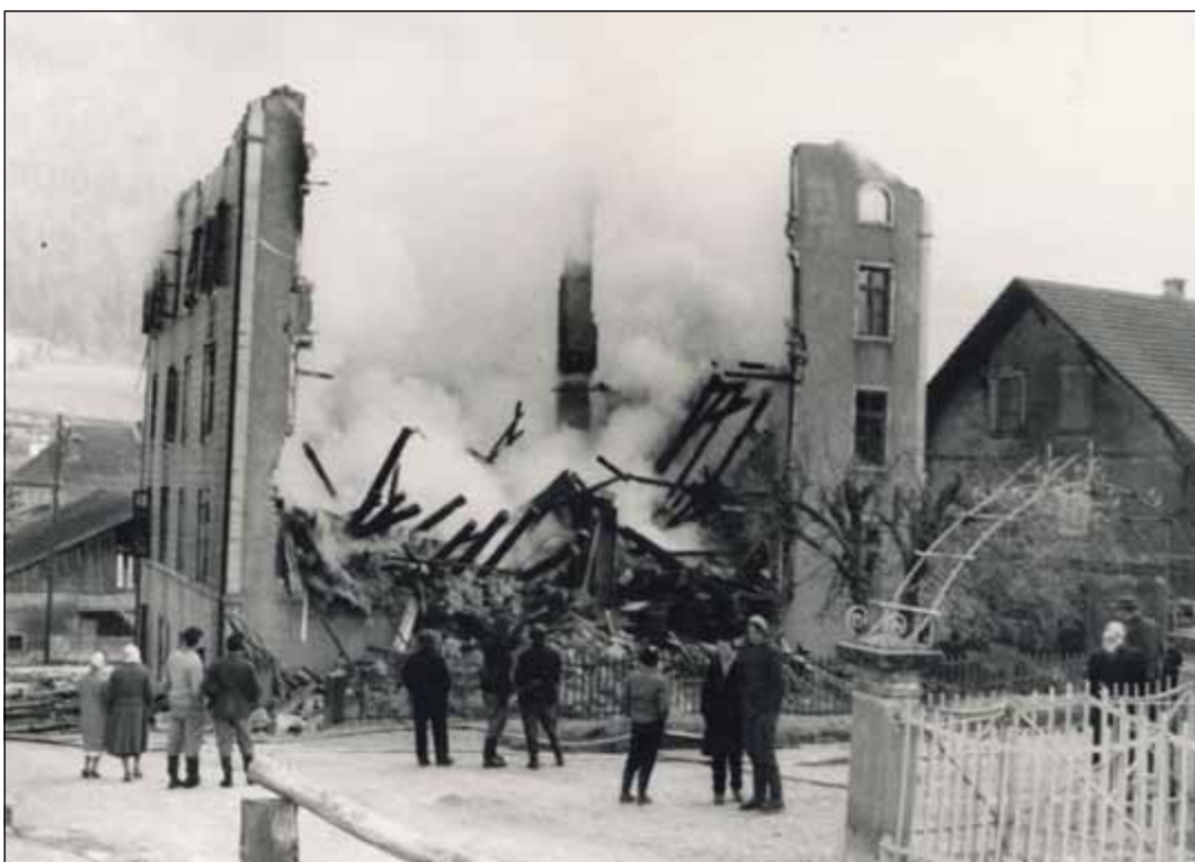
Ce qu'il restait de l'école au matin du 30 janvier 1959, après un incendie nocturne.